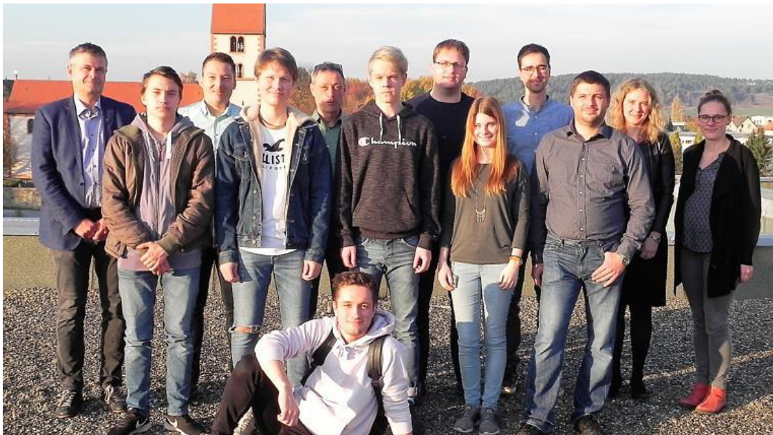
Kuva viimeiseltä päivältä, kuvassa koulun opettajat ja yritysten vastuhenkilöt

Työpaikalla oli kuvienottokielto ja jouduin allekirjoittamaan sopimuksen, että en julkista heidän dataa, mutta tässä on muutama kuva Saksasta.