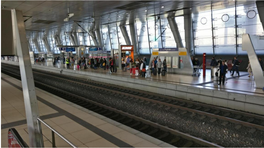
Frankfurtin lentokentän juna-asema