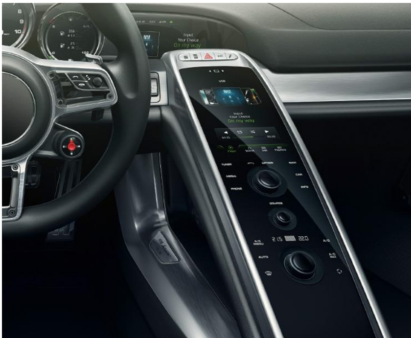
Prehin valmistama keskikonsoli Porsche 918 Spideriin

Preh on autoalan yritys, jonka perustettiin Bad Neustadtissa vuonna 1919 ja heillä on nykyään vähän alle seitsemäntuhatta työntekijää, Preh tekee autoihin keskikonsoleita ja muita sisätilan nappeja, heidän asiakkaisiin kuuluu BMW, Porsche, Audi, Volkswagen, Lamborghini yms.