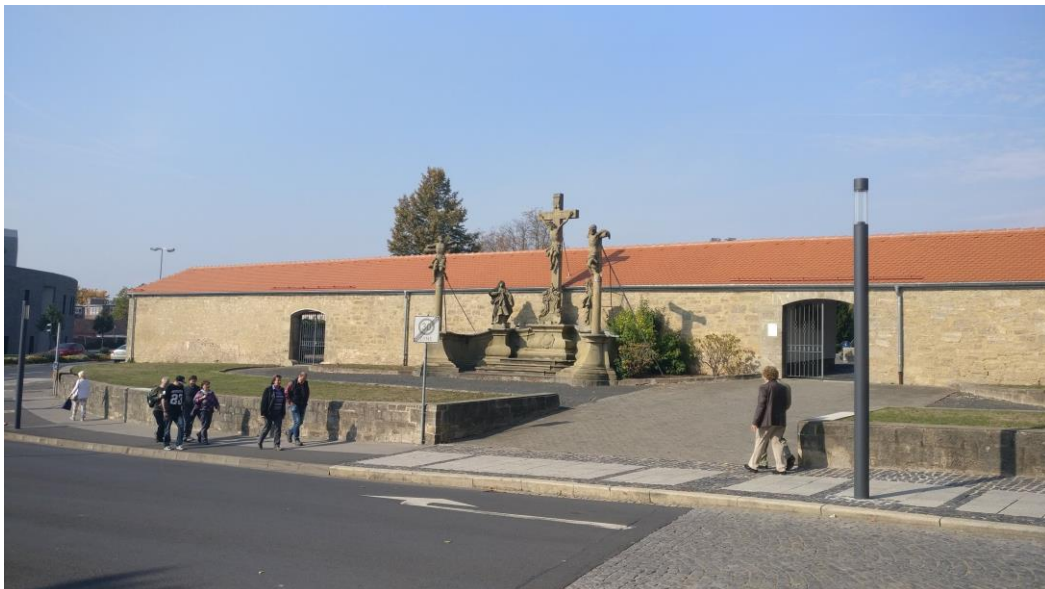
Katolisen kirkon monumentti