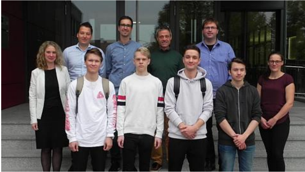
Kuva ensimmäiseltä päivältä, kuvassa me neljä ja koulun opettajat