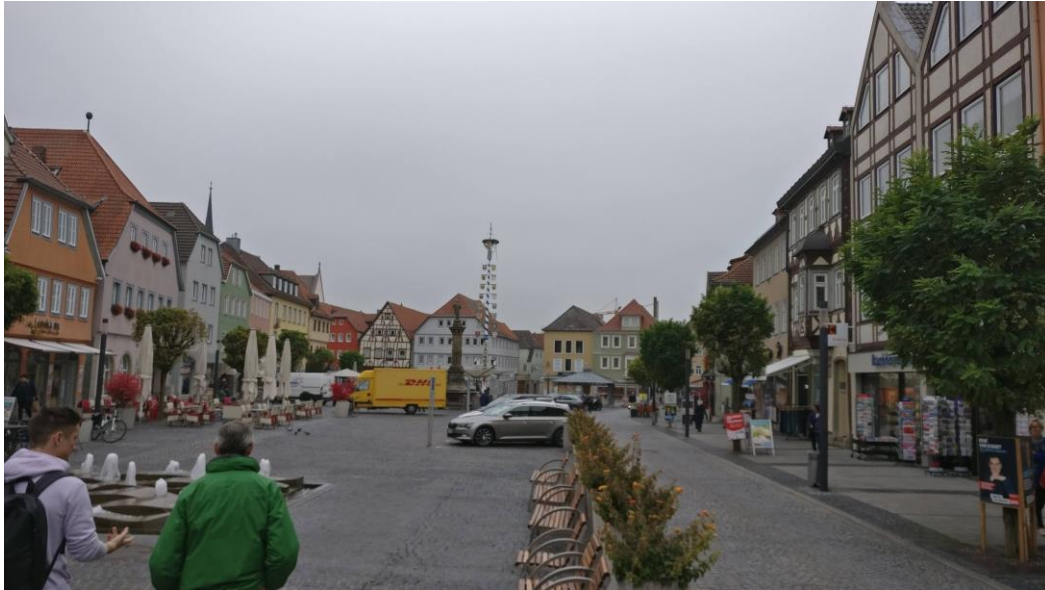
Kuvassa Bad Neustadtin keskusta