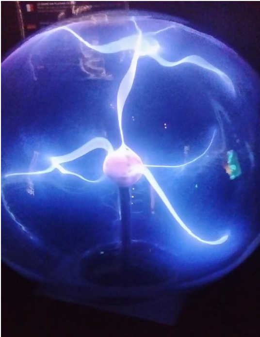
Camera Obscura & Illusion World

huomattavan paljon suurempi. Lapset pääsevät melkein kaikkiin nähtävyyksiin puoleen hintaan, mutta opiskelijan paratiisi se ei ole, sillä opiskelijakortilla saatavat alennukset nähtävyyksistä ovat minimaalisia. Lisäksi iltaisin tekemistä on varsin vähän, sillä aukioloajat ovat hyvin rajalliset.