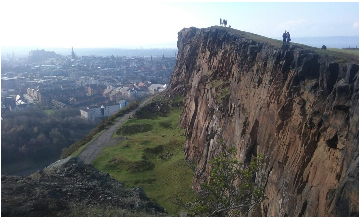
Kuva Arthur's Seat:ta

Skotlannin matkani alkoi mukavasti lomaviikolla, koska olin varannut matkaan viisi viikkoa joista työharjoittelu tulisi kestämään neljä viikkoa. Lomaviikon oli tarkoitus sijoittua aluksi tuon ajan loppupäähän, mutta koska sain majoituksen harjoittelupaikkani läheltä ensimmäisiksi neljäksi viikoksi, päädyin siirtämään harjoittelun ajankohtaa viikolla eteenpäin. Näin välttyin logistisilta ongelmilta, joita olisi muutoin tullut. Paja, jossa työharjoittelu järjestettiin, oli todellakin melkoisen hankalassa paikassa. Sinne ei edes julkisilla kulkuneuvoilla päässyt. Minulla oli nyt sitten ensimmäinen viikko aikaa tutustua kaupunkiin ja ottaa selvää kaikesta olennaisesta mitä uuteen maahan muutettaessa tulee tietää. Tuli kierreltyä kaupunkia, käytyä ravintoloissa ja kuppiloissa, sekä vierailtua Arthur's Seat:lla, joka on suuri kukkula lähellä Edinburghin keskustaa. Kävin myös tällä viikolla jo tutustumassa tulevaan työharjoittelupaikkaani P. Johnson & Company:n, jotta osaisin seuraavalla viikolla sitten kulkea sinne. Paja vaikutti lupaavalta ja sepät mukavilta, joskin tässä vaiheessa minulla oli vielä suuria hankaluuksia ymmärtää tuota skotlannin mongerrusta, jota englanniksikin siellä päin kutsutaan.